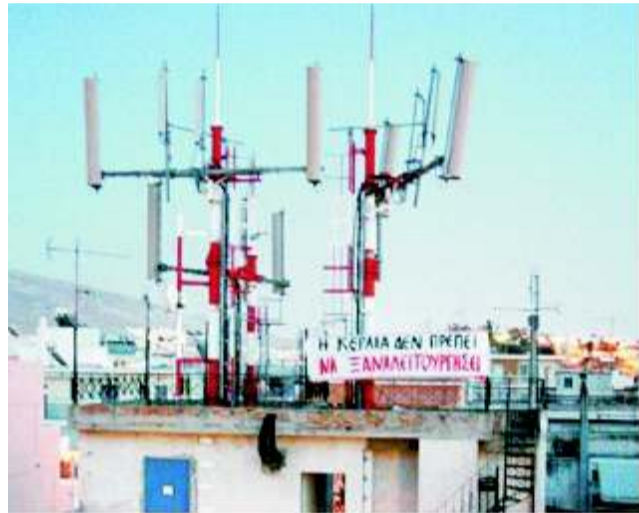
Οι διαμαρτυρίες για κεραίες κινητής τηλεφωνίας εγκατεστημένες σε ταράτσες πολυκατοικιών είναι συχνό φαινόμενο

Στο «κόκκινο» μπαίνουν για την ανθρώπινη υγεία κινητή τηλεφωνία, ασύρματα διαδίκτυα, ηλεκτρικές γραμμές υψηλής τάσης, ραδιοτηλεοπτικές κεραίες!